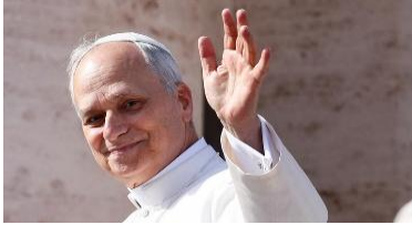
Papst Leo XIV.

Wir beten für die Priester, die mit Momenten der Krise in ihrer Berufung kämpfen, dass sie die ihnen nötige Begleitung finden und dass die Gemeinschaften sie mit Verständnis und Gebet unterstützen.