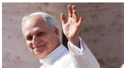
Papst Leo XIV.